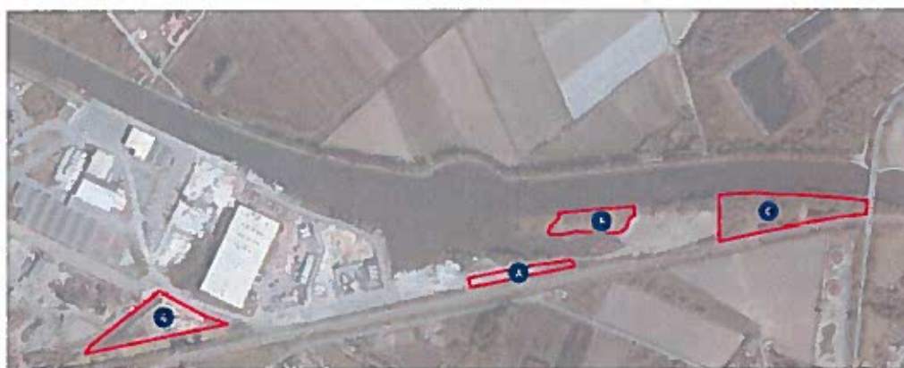
Localisation des mesures compensatoires - Janvier 2016